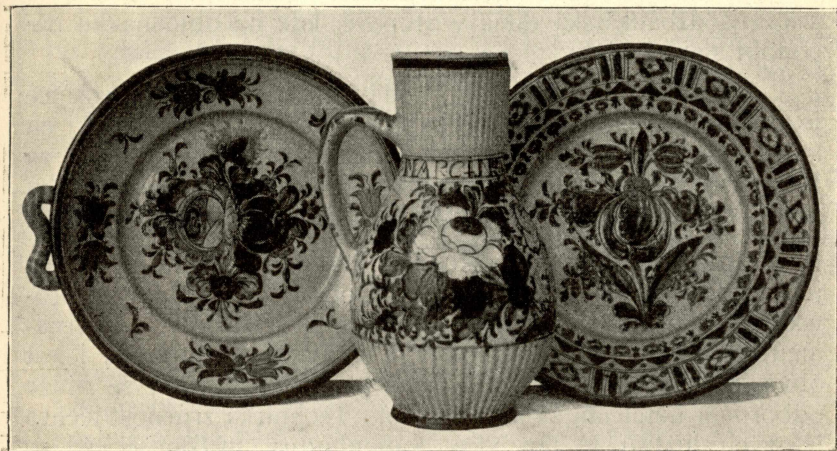
Slovenská majolika (habánská) novějšího druhu.

Předměty, jež džbánkáři hotovili, byly rozmanité co do podoby, velikosti a svého určení. Byly to baňaté větší a menší krpky a črpáky, džbánky a džbány na nápoje, někdy i na 10—12 až i na 40 litrů; dále mísy, vasy, květníky, kalamáře a j., též i reliefně vypuklé anebo tabulové obrazy, všechno ušlechtilým ornamentem v barvách účinně působících pomalované. Předměty tyto nebyly ke kuchyňské potřebě, jelikož byly křehké, ale byly výlučně určeny účelům ozdobným. Proto všechny mísky, talíře a pod. byly na zevnější straně obruby (o b t á č c e)